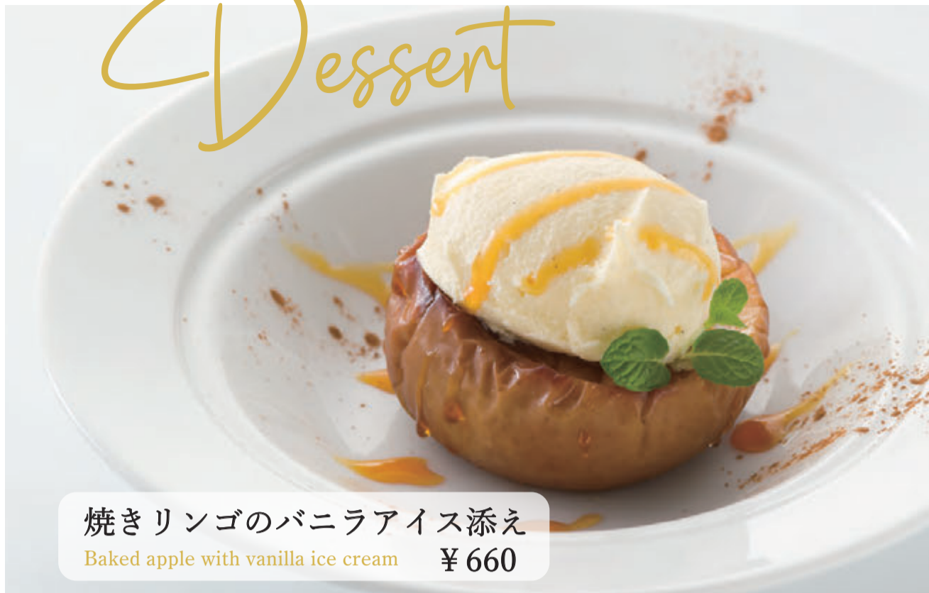
焼きリンゴのバニラアイス添え Baked apple with vanilla ice cream ¥660