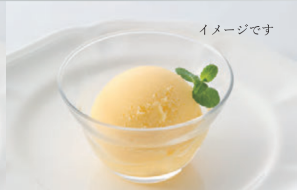
バニラアイスクリーム Vanilla ice cream ¥495